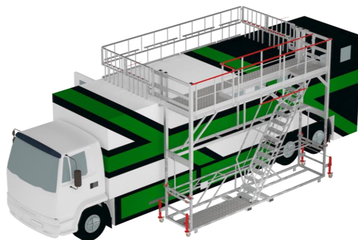
3D-Ansicht der Struktur mit entfaltbarer Ring

Wartungsplattform , die speziell für die Instandhaltung von Pferdetransportern entwickelt wurde, sei es für umgebaute Fahrzeuge oder einfache Transporter für den Pferdetransport. Mit einer robusten und widerstandsfähigen Struktur ermöglicht die Plattform einen einfachen und sicheren Zugang für die Bediener.