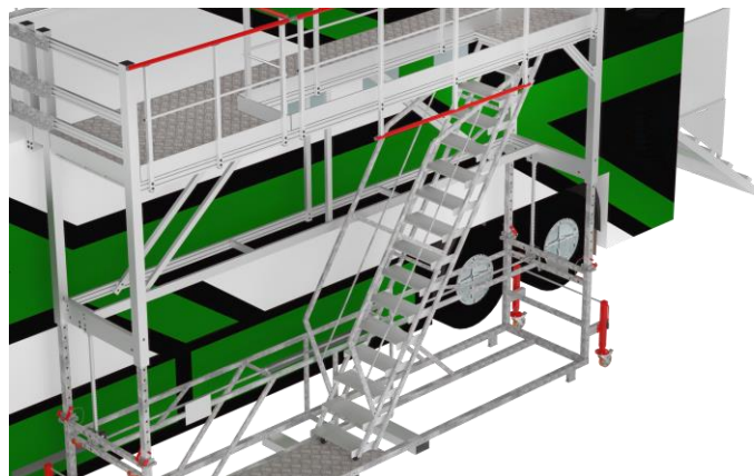
3D-Ansicht der Zugangstreppe